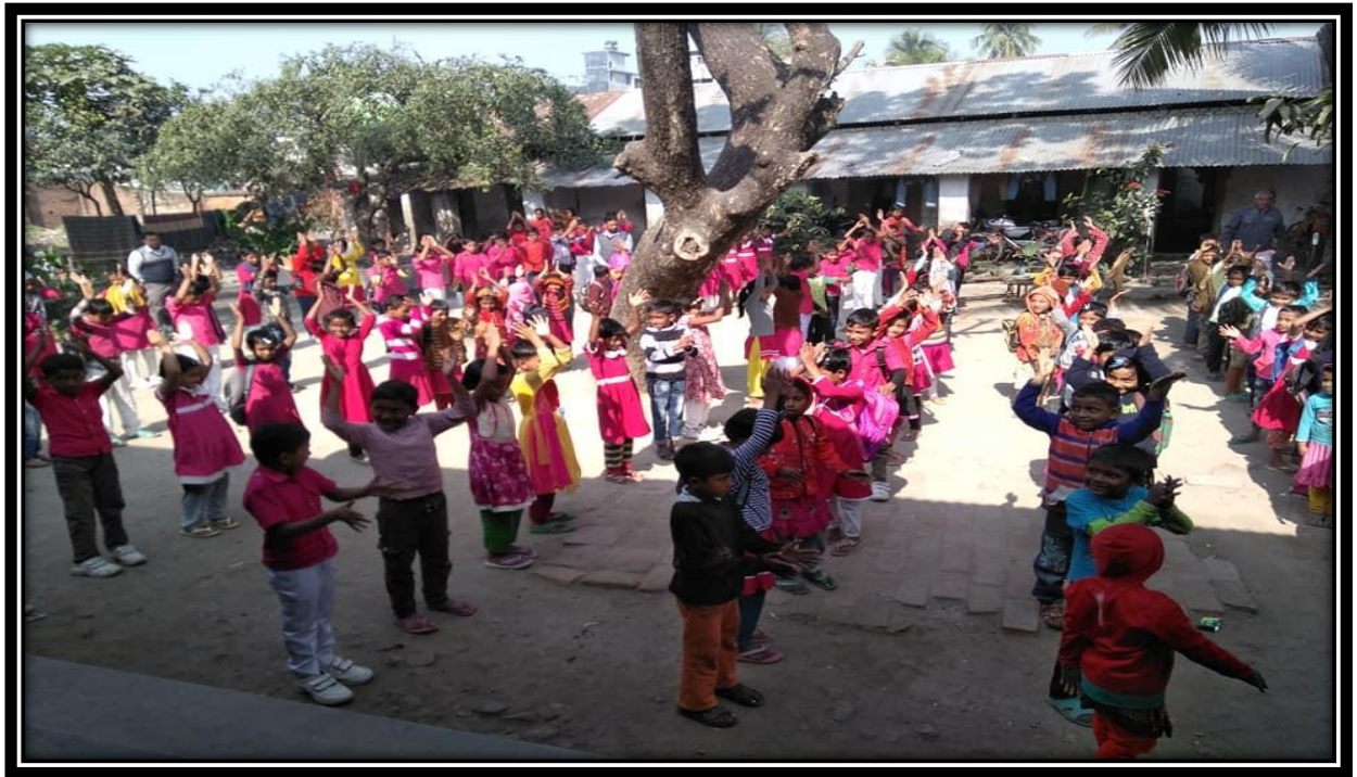
শিশু কল্যাণ প্রাথমিক বিদ্যালয়-৭৭, কেশোবপুর, যশোর