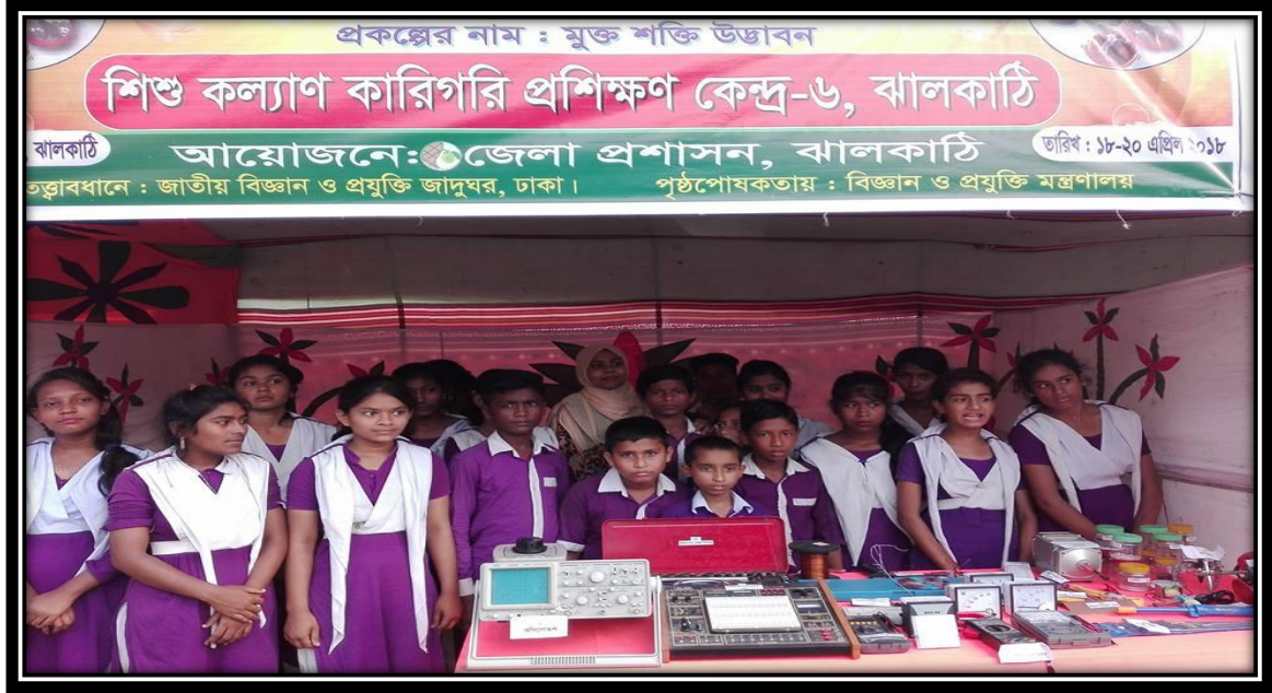
শিশু কল্যাণ কারিগরি প্রশিক্ষণ কেন্দ্র-৬, ঝালকাঠি