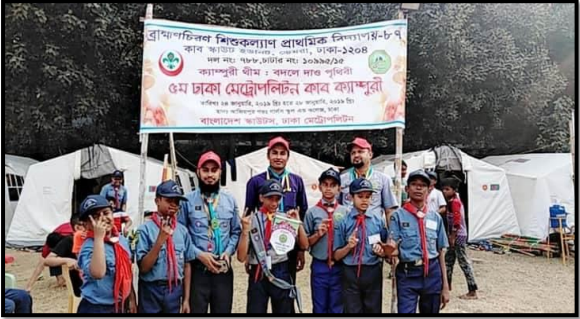
ব্রাহ্মণচিরণ শিশু কল্যাণ প্রাথমিক বিদ্যালয়-৮৭, ধলপুর, ঢাকা এর কাব স্কাউটস কার্যক্রমের একাংশ