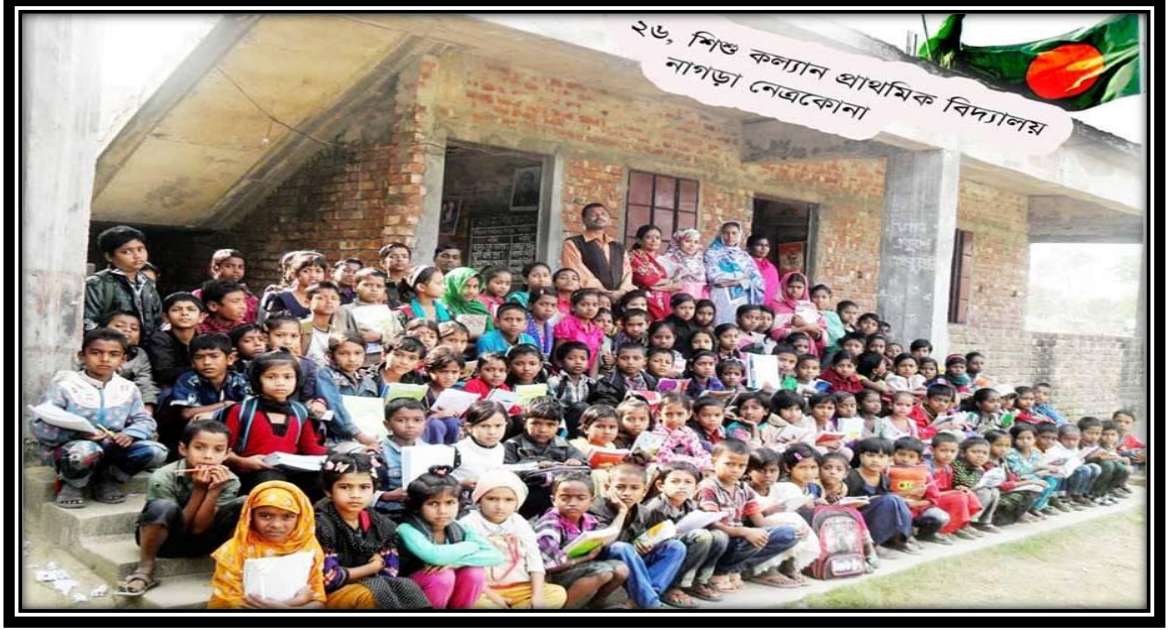
শিশু কল্যাণ প্রাথমিক বিদ্যালয়-২৬, নেত্রকোণা