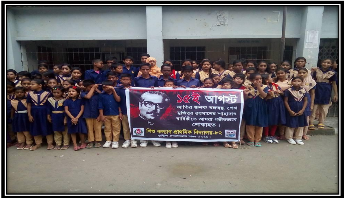
শিশু কল্যাণ প্রাথমিক বিদ্যালয়-৮২, কুড়িল, ঢাকা ১৫ আগস্ট জাতীয় শোক দিবস পালন