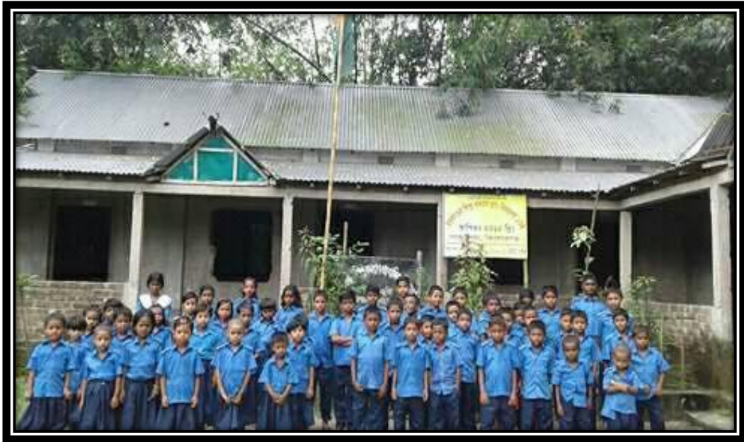
শিশু কল্যাণ প্রাথমিক বিদ্যালয়-১০৪, পাকুন্দিয়া, কিশোরগঞ্জ