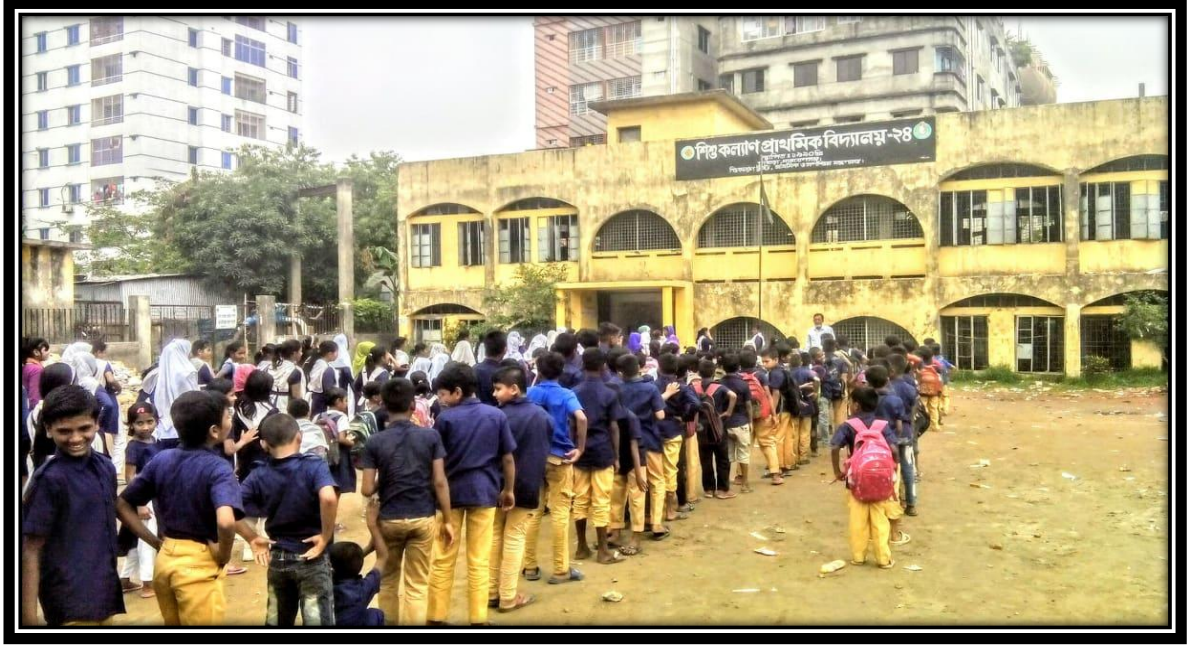
শিশু কল্যাণ প্রাথমিক বিদ্যালয়-২৪, চাষাড়া, নারায়ণগঞ্জ এ দৈনিক সমাবেশের একাংশ