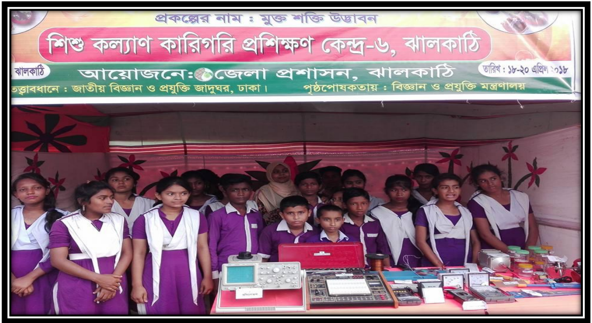
শিশু কল্যাণ কারিগরি প্রশিক্ষণ কেন্দ্র-৬, ঝালকাঠি