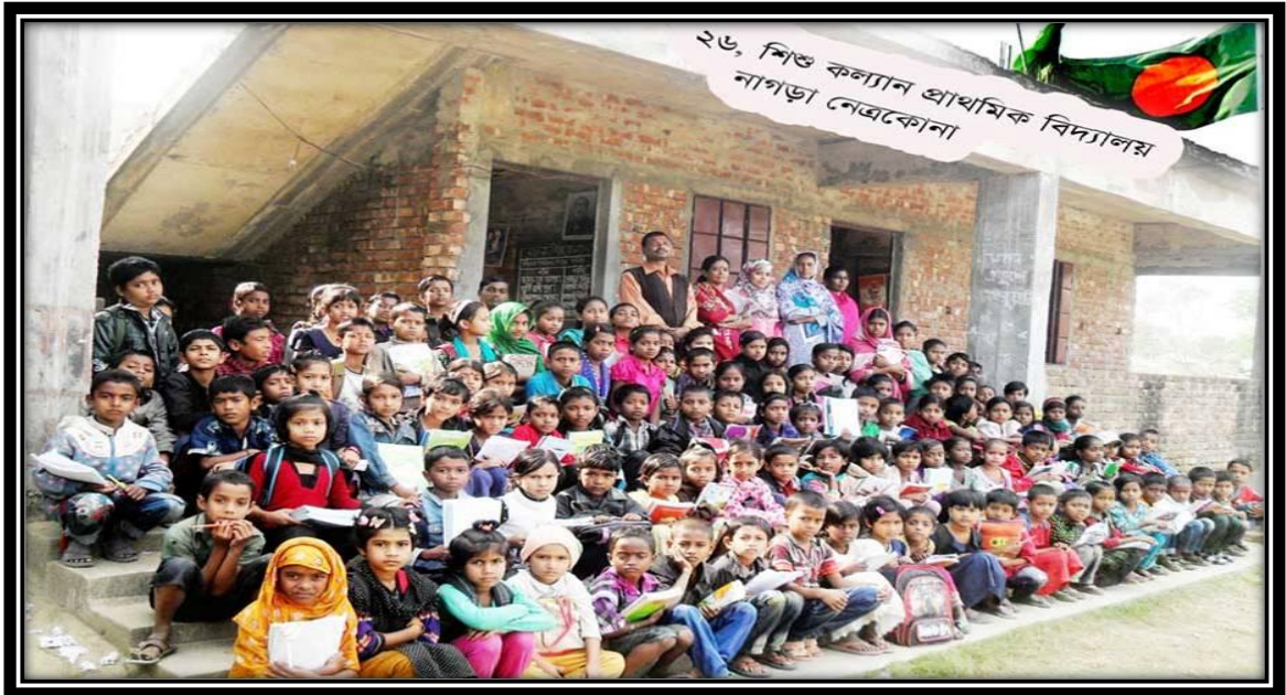
শিশু কল্যাণ প্রাথমিক বিদ্যালয়-২৬, নেত্রকোণা