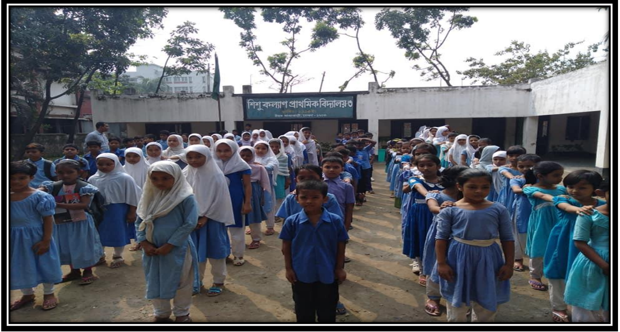
শিশু কল্যাণ প্রাথমিক বিদ্যালয়-০৩, যাত্রাবাড়ী, ঢাকা