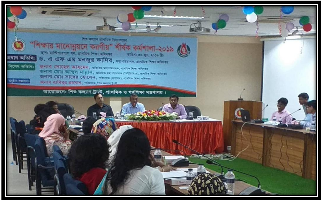
শিশু কল্যাণ প্রাথমিক বিদ্যালয়ের শিক্ষার মানোন্নয়নে করণীয় শীর্ষক কর্মশালা-২০১৯ এর একাংশ

শিশু কল্যাণ ট্রাস্ট পরিচালিত প্রাথমিক বিদ্যালয়সমূহের ছাত্র-ছাত্রীগণ সরকারি প্রাথমিক বিদ্যালয়ের ন্যায় সরকার প্রদত্ত মাসিক ১০০/-টাকা হারে উপবৃত্তি সুবিধা ভোগ করেন। ২০১৭- ২০১৮ আর্থিক সালে উপবৃত্তির সুবিধা ভোগকারি শিশু কল্যাণ প্রাথমিক বিদ্যালয়সমূহের ছাত্র-ছাত্রীর সংখ্যা ৩১,৮৫০ জন।