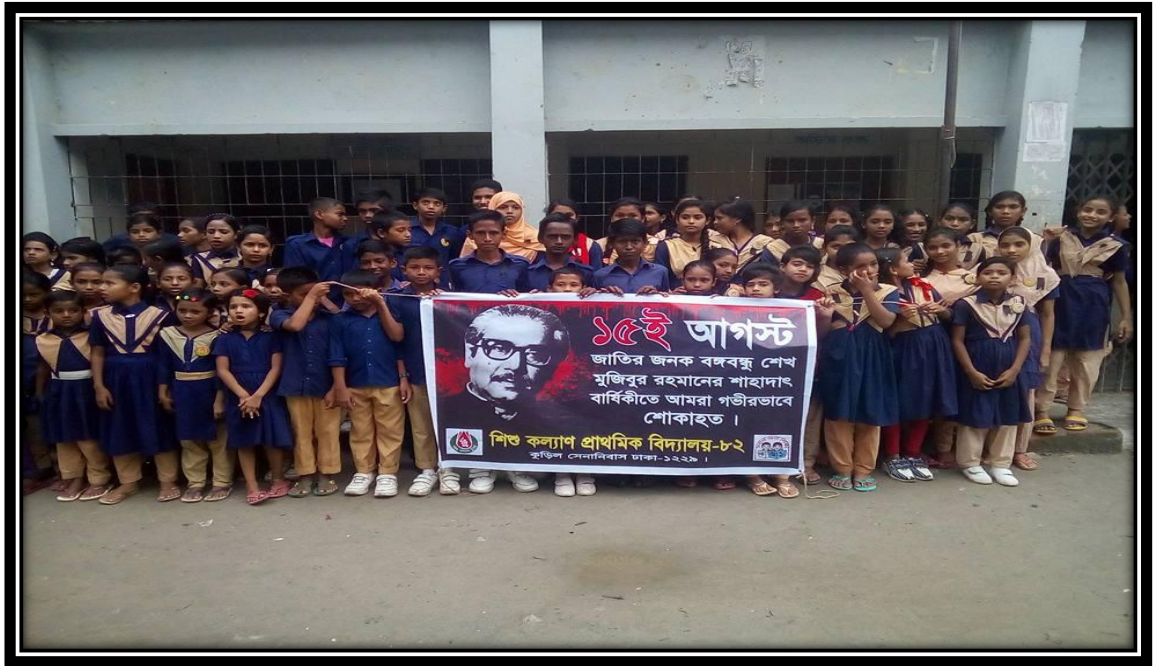
শিশু কল্যাণ প্রাথমিক বিদ্যালয়-৮২, কুড়িল, ঢাকায় ১৫ আগস্ট জাতীয় শোক দিবস পালন