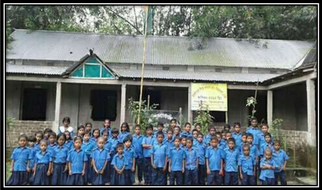
শিশু কল্যাণ প্রাথমিক বিদ্যালয়-১০৪, পাকুন্দিয়া, কিশোরগঞ্জ

(৬) বিদ্যালয় পরিদর্শনঃ ঢাকা মহানগরীসহ জেলা/উপজেলা পর্যায়ের শিশু কল্যাণ প্রাথমিক বিদ্যালয় এবং কারিগরি প্রশিক্ষণ কেন্দ্রের লেখাপড়ার মান উন্নীত করার লক্ষ্যে ট্রাস্টের কর্মকর্তাগণ কর্তৃক বিদ্যালয় ও প্রশিক্ষণ কেন্দ্রসমূহের কার্যক্রম মনিটরিং/পরিদর্শন করা হয়েছে।